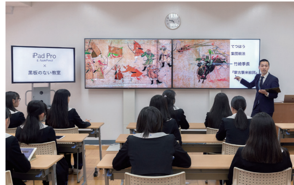
教室に黒板を設けず、教科学習を含むすべてのカリキュラムで4K大画面ディスプレイとiPad Proなどの先端ICTを活用。ライブ感あふれる双方向授業が同校の特徴です。授業進度や生徒の理解度も格段に向上しています。

1926(昭和1)年の創立時より、「真に社会に貢献できる有為な近代女性の育成」を理念とする瀧野川女子学園。教