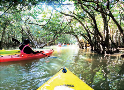
中学2年次と高校1年次、校外学習で奄美大島へ。「人生観が変わる」と大好評

大正15年創立の瀧野川女子学園は、37歳教員出身の主婦が自宅の二階でながらベンチャー企業のように始まった学校。イノベーションと国際化による時代の変化を見据えて、その大切に行っている「創造性」と「起業家精神」を育むために、2015年に始めた中高6年間に渡る独自の授業が「創造性教育」です。その成果は目覚しく、2021年の大学入試改革初年度に、難関大学を含め、総合型選抜で前年比4倍の合格実績を記録し、今春も年内現役大学進路決定80%を達成しています。さらに、この創造性教育の取り