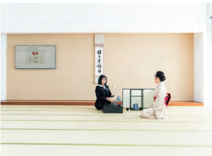
礼法や茶道、華道を通じて、大人の日本女性としての心を育みます