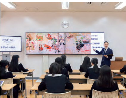
全普通教室には黒板の代わりに3台の大型ディスプレイを導入

キャリア教育の1期生は、「マネジメントのおもしろさを知った」と、現在、大手商社でベンチャー企業の支援を行っているそう。同校の学びを基盤に、社会で活躍する卒業生が大勢いるのも、後輩の励みになっています。