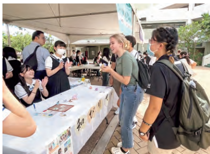
チャリティーバザーでは、各グループが創意工夫して新商品を開発